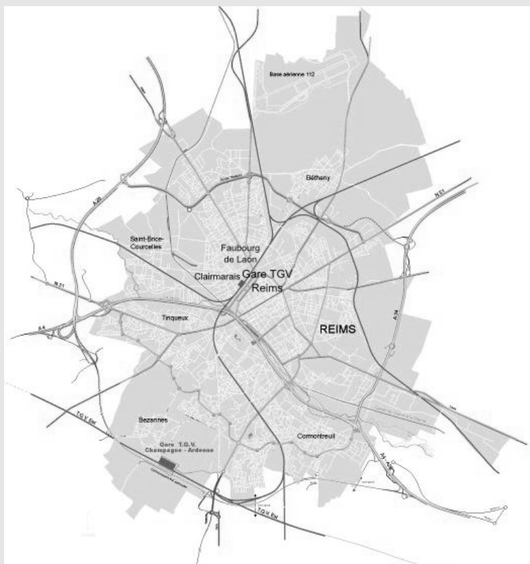
Figure 2 – La localisation des quartiers Clairmarais et Faubourg de Laon par rapport à la gare TGV de Reims

mutation. Outre près de 70 000 m 2 de bureaux qui seront, à terme, disponibles immédiatement derrière la gare, l'habitat résidentiel connaît des évolutions notables qui sont capitalisées dans les prix immobiliers, ce qui peut expliquer en partie leur progression localisée. Les pouvoirs publics ont mené une politique active visant à reconstruire le quartier de la gare. Ils ont favorisé la construction d'un quartier d'affaires immédiatement derrière la gare TGV tout en imposant l'existence de logements dans le quartier afin d'assurer une mixité de ses fonctions.