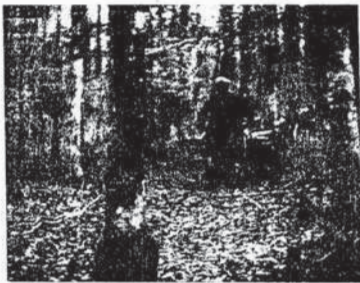
LE MASSIF VOSGIEN. — Les Schlittes.

« Le Massif Vosgien sera hautement apprécié dans les milieux d'enseignement. Il présentera également un très grand intérêt dans les séances éducatives post-scolaires.