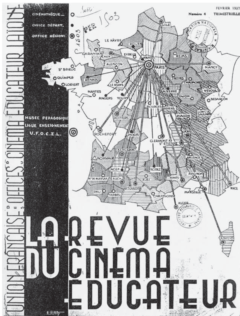
Couverture de la Revue du cinéma éducateur , n°4, février 1937.