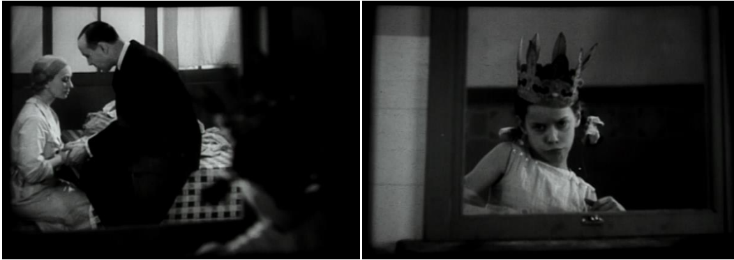
Le point de vue de l'enfant dans la Maternelle