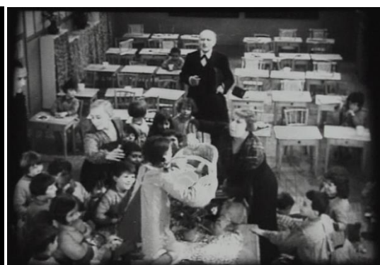
L'expérience « lapinologique » dans la Maternelle