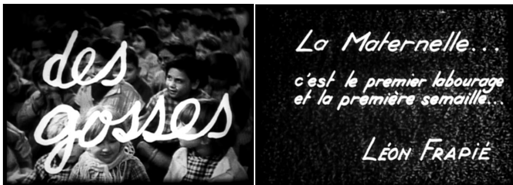
La double ouverture générique dans la Maternelle