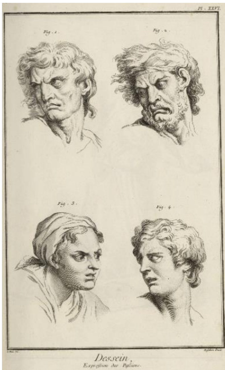
L'Encyclopédie . Volume 24. Planches 3, 1763, Planche XXVI, Bibliothèque Mazarine, 2° 3442 Volume 24, https://mazarinum.bibliotheque-mazarine.fr/idurl/1/2135