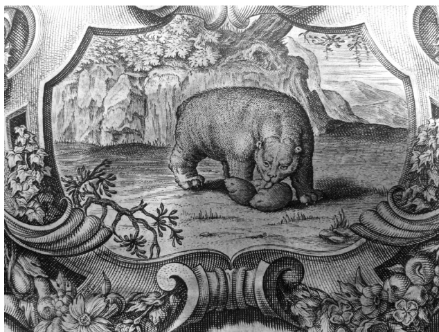
Figure 2. L'ourse léchant son petit, symbole de l'élan éducatif et missionnaire, vignette sur cuivre non signée : Imago primi saeculi Societatis Jesu , Anvers, B. Moretus, 1640, in-fol., p. 465, collection privée.