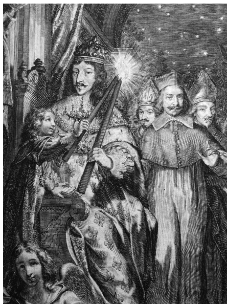
Figure 9. Grégoire Huret, titre-frontispice sur cuivre (détail) : Le Flambeau du Juste pour la conduite des esprits sublimes, dédié au Roy , du R. P. Sébastien de Senlis, Paris, Vve N. Buon, 1643, in-4°, collection particulière.