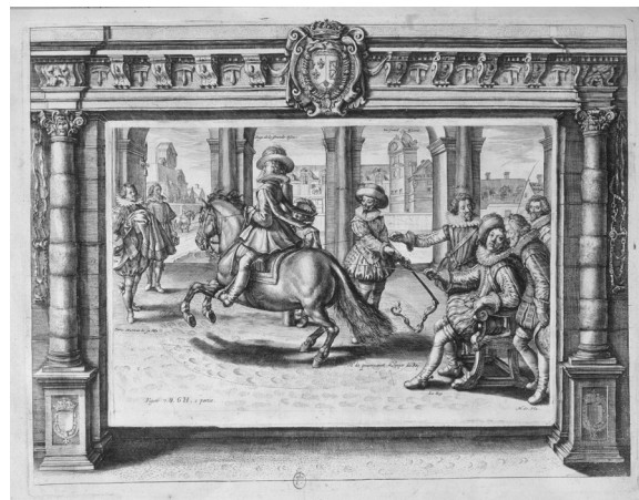
Figure 8. Crispin de Passe le Jeune : le Manège royal ... gravé et représenté en grandes figures de taille-douce par Crispian de Pas, [édition par J-D. Peyrol], Paris, aux frais de Crispian de Pas, chez G. Le Noir, 1623, in-fol., bibliothèque de l'Arsenal. En même temps qu'il écoute son maître d'équitation, le roi bénéficie presque immédiatement d'enseignements pratiques.