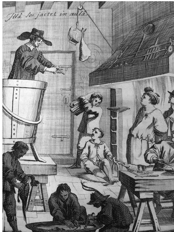
Figure 4. François Chauveau, frontispice sur cuivre (détail): Gilles Ménage, Vita M. Gargilii Mamurrae parasitopaedagogi, scriptore Marco Licinio , Luteciae, 1643, in-4°, collection privée.