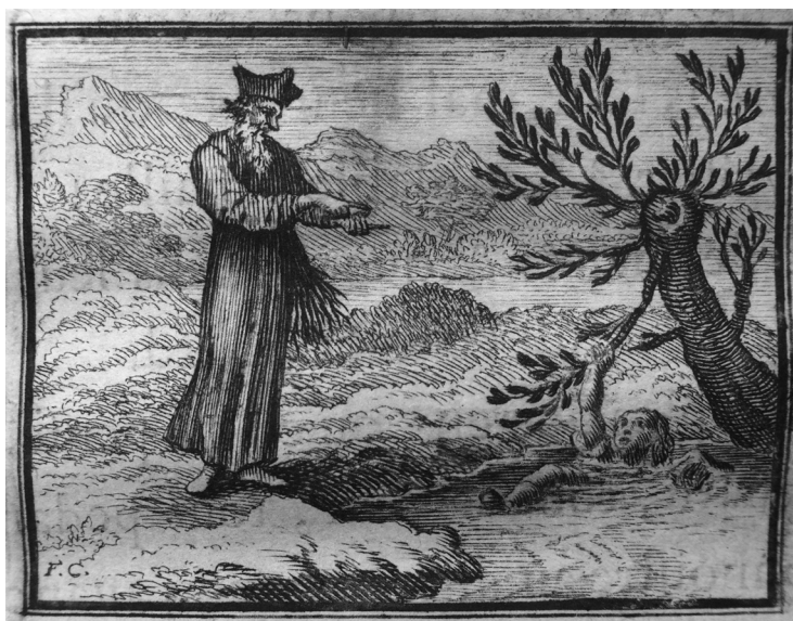
Figure 6. François Chauveau, vignette sur cuivre : Jean de La Fontaine, Fables choisies mises en vers , Paris, C. Barbin, 1668, in-4°, collection privée.