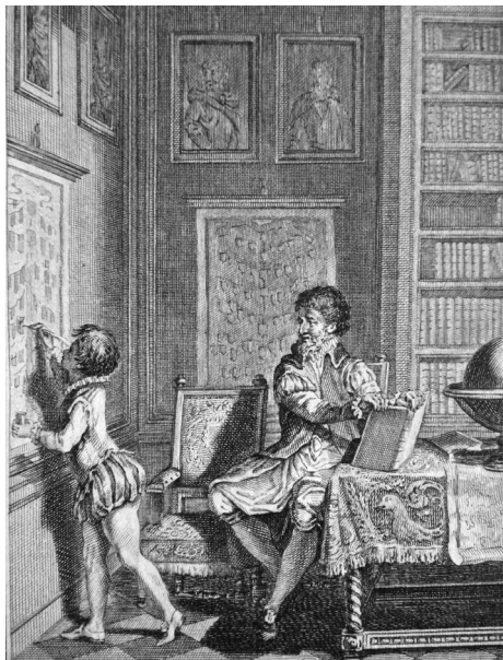
Figure 1. Le futur Henri IV en compagnie de son précepteur La Gaucherie dans une bibliothèque, gravure sur cuivre en pleine page : dans L'Éducation de Henri IV . Par M***, Béarnais. Orné de six figures. Dessinées par Marillier et gravées par Duflos le Jeune, Paris, Duflos le Jeune, 1790, in-8°, première partie, p. 34, collection privée.