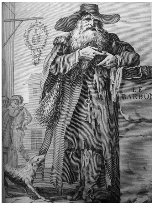
Figure 5. François Chauveau, frontispice sur cuivre : Jean-Louis Guez de Balzac, Le Barbon , Paris, A. Courbé, 1648, in-8°, collection privée.