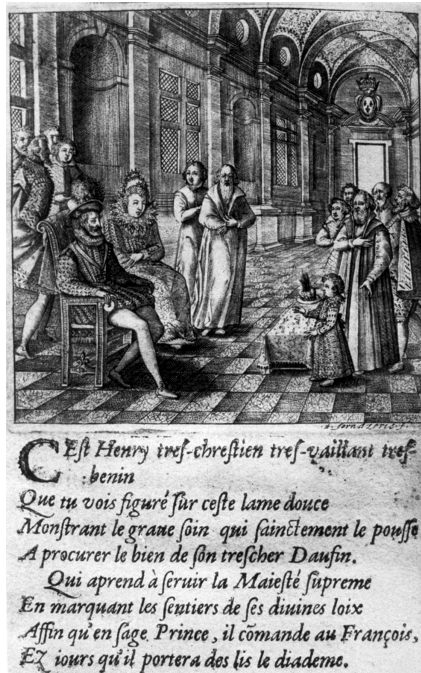
Figure 7. Jacques Fornazeris, estampe gravée sur cuivre : Louis Richeome, Catéchisme royal dédié à Monseigneur Louys de Bourbon, dauphin de France, en la cérémonie de son baptesme , Lyon, J. Pillehotte, 1606, in-12, collection privée.