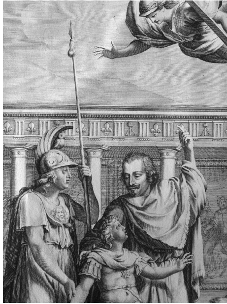
Figure 11. Charles Errard, gravure sur cuivre à pleine page (détail): La Doctrine des mœurs de Gomberville, Paris, P. Daret et L. Sevestre, 1646, in-fol., collection privée.