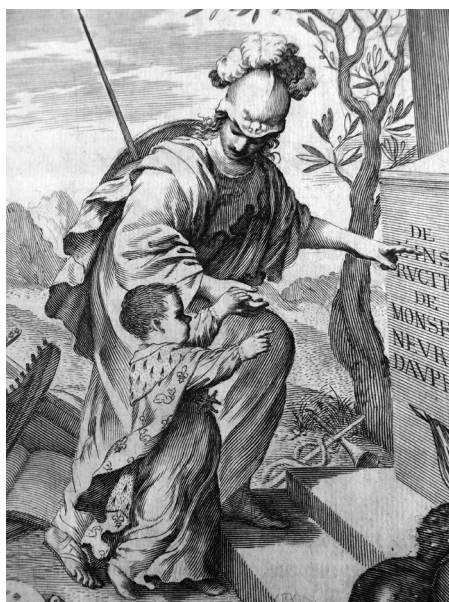
Figure 10. Claude Mellan, titre-frontispice sur cuivre (détail) : De l'instruction de Mgr le Dauphin de François de La Mothe Le Vayer , Paris, S. Cramoisy, 1640, in-4°, collection privée.