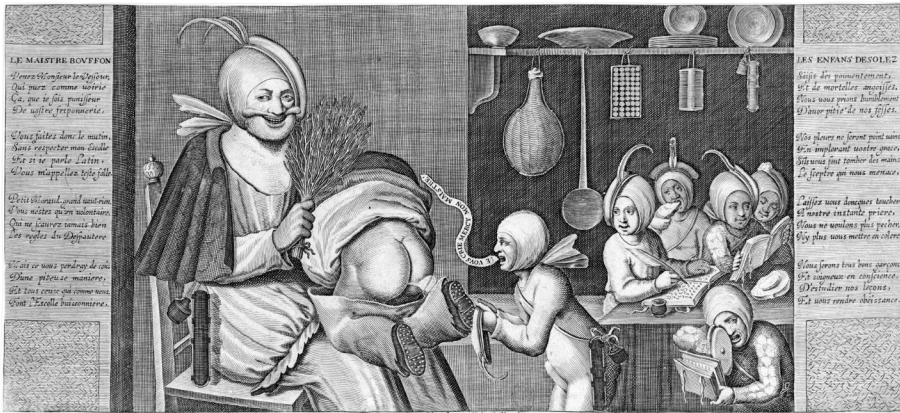
Figure 3. Jaspas Isaac, Le Maître bouffon , placard satirique gravé sur cuivre, 1634, BnF, Département des Estampes et de la photographie.