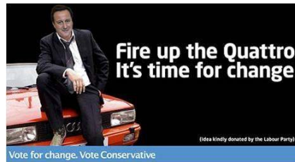
Fig. 17: Affiche du Parti Conservateur (2010)

Décidemment, le DCI du commissariat de Fenchurch mène à présent une existence indépendante des séries qui l'ont mis en scène.