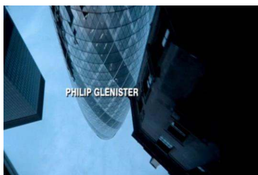
Fig. 4 : Ashes to Ashes , générique d'ouverture du pilote.

Simultanément, une voix-off non identifiée, aux accents enfantins, lit le dossier psychologique du policier, faisant le récit de ses délires, reprenant à l'identique le leitmotiv du personnage, répété en ouverture de chaque épisode de Life on Mars , refrain bien connu du téléspectateur : « My name is Sam Tyler. I had an accident and I woke up in 1973. Am I mad, in a coma or back in time? Whatever had happened, it was like I'd landed on a different planet. If I could figure out why I was here, then maybe I could get back home. » Ashes to Ashes s'inscrit ici dans la continuité et dans la rupture. Alex Drake, profilleuse pour la Metropolitan Police, n'est autre que la psychologue brièvement et anonymement évoquée par Sam dans le dernier épisode de Life on Mars . Dans toute cette séquence d'ouverture, la ville de Londres est filmée en contre-plongée, telle une image en miroir offrant une symétrie inversée comme un reflet et produisant déjà un sentiment de défamiliarisation, alors même qu'il s'agit encore du réel (voir figure-4).