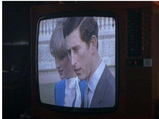
Fig. 6 : La télévision regarde la télévision ( Ashes to Ashes , saison 1, épisode 2).

promoteurs, leur pub traditionnel doit être détruit pour laisser place à un immeuble de bureaux ou d'habitations bourgeoises. Le mariage retransmis à la télévision est un spectacle, une fiction nationale qui dissimule mal ses artifices : il est cantonné au cadre de l'écran du téléviseur (voir figure 6).