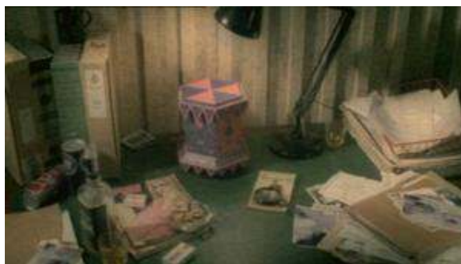
Fig. 10 : La version adulte et policière de Camberwick Green dans Life on Mars .

Le pré-générique de cet épisode de Life on Mars reprend les codes visuels et narratifs établis par l'émission pour enfants : la voix off du narrateur emprunte les mêmes intonations et reproduit, à quelques détails près, la même formule rituelle. Pour autant, la marionnette est celle de Sam, reconnaissable à sa veste en cuir et à son pantalon à pattes d'éléphant (voir figure 11) :