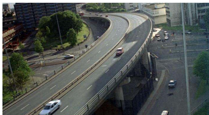
Fig. 2: Manchester en 2006