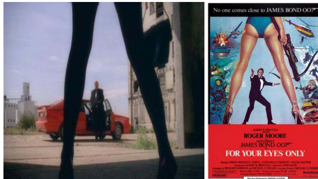
Fig. 13 ... ou nouvelle incarnation de l'éternel masculin britannique 21 ?

Il le constate lui-même : « My reputation precedes me » ; son personnage est préconstruit grâce à la première série. Gene Hunt est le héros autodéterminé d'un western urbain : son identité, on l'apprend