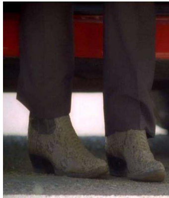
Fig. 12: Gene Hunt : cowboy des temps modernes...

celle des héros représentés sur les affiches de films qui décorent les murs de son bureau.