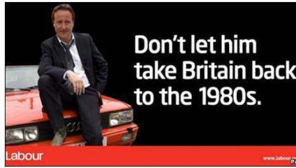
Fig. 16 : Affiche du Parti Travailleiste (2010)