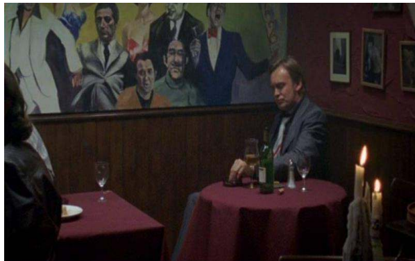
Fig. 14 : Gene Hunt : nouvelle figure d'un patrimoine populaire ?

dans la conclusion de Ashes to Ashes , est une construction qui reprend des « morceaux » du patrimoine populaire, identité factice, fantasmée, élaborée par un jeune policier tué avant que d'avoir fait carrière. L'hybridité du personnage est primordiale et explique le patchwork référentiel qui définit les séries : Sam et Alex n'évoluent pas dans leur propre esprit mais dans celui de Gene, archange psychopompe qui accompagne les policiers dans l'acceptation de leur mort. Outre les échos aux chansons, films et émissions de télévision qui caractérisent la rhétorique des deux séries, ces dernières mettent en place un jeu de rimes internes qui permettent l'élaboration d'un nouveau mythe qui leur est propre. Gene Hunt en est le point d'orgue. Son vocabulaire fleuri émaille les épisodes et caractérise le personnage, le rendant unique et reconnaissable: « bollyknickers », « fire up the quattro », « kicking a nonce ». Gene Hunt finit par appartenir au patrimoine populaire, notamment lorsqu'il est filmé en plan fixe, assis devant le « wall of fame » de la pizzeria où l'équipe a ses habitudes 22 (voir figure 14).