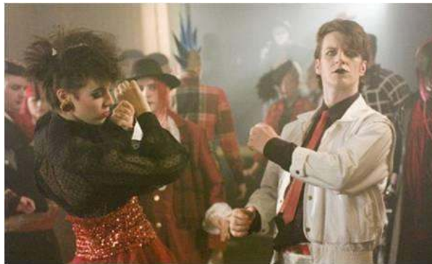
Fig. 5 : Reconstitution du Blitz Club dans Ashes to Ashes (saison 1, épisode 2).

chanteurs, parmi d'autres figures populaires, apparaissent comme des personnages secondaires, qui peuvent illustrer un fait de société ou brouiller la ligne de démarcation entre le réel et l'imaginaire. Ainsi, les revendications de la cause homosexuelle sont représentées en toile de fond de l'épisode 8 de la Saison 1 : l'animateur de radio et fondateur de la New Wave , Tom Robinson, est jeté en prison pour avoir manifesté et il entonne avec ses compagnons de cellule ses célèbres chansons « 2-4-6-8 Motorway » et « Glad to be gay ». Si Tom Robinson est incarné par un acteur, certains artistes interprètent leur propre rôle. Le caméo le plus notable est celui de Steve Strange, le chanteur de Visage, qui interprète son « nouveau » titre « Fade to Grey » : tout l'excès de la fête est ici convoqué – le nightclub « Blitz » près de Covent Garden, berceau des New Romantics ; les maquillages et costumes outranciers ; les attitudes figées des danseurs. L'artifice, à maints égards, est ici l'enjeu même de la fête (voir figure 5).