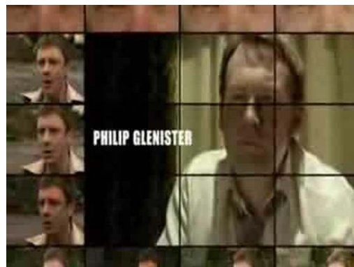
Fig. 7: générique d'ouverture de Life on Mars .

La télévision, comme motif ou métaphore, devient un outil herméneutique pour le héros désorienté. Le générique d'ouverture de Life on Mars , qui n'apparaît pas dans l'épisode pilote, souligne d'emblée l'importance donnée aux écrans dans les deux séries (voir figure 7).