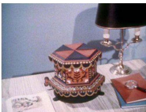
Fig. 9 : La version originale du générique d'ouverture de Camberwick Green .