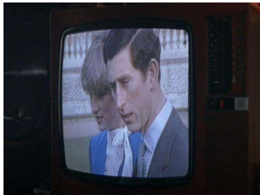
Fig. 6 : La télévision regarde la télévision ( Ashes to Ashes , saison 1, épisode 2).

promoteurs, leur pub traditionnel doit être détruit pour laisser place à un immeuble de bureaux ou d'habitations bourgeoises. Le mariage retransmis à la télévision est un spectacle, une fiction nationale qui dissimule mal ses artifices : il est cantonné au cadre de l'écran du téléviseur (voir figure 6).