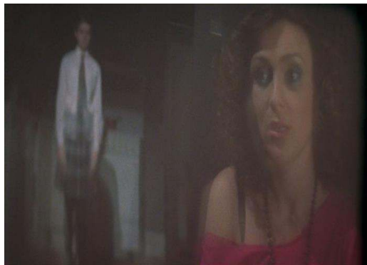
Fig. 8: Ashes to Ashes , saison 1, épisode 1.

La télévision comme véhicule d'une culture populaire commune aux héros et aux téléspectateurs est présentée comme un interlocuteur fautif, voire trompeur. Sam et Alex se tournent vers le poste de télévision pour trouver une vérité qu'ils peinent à déchiffrer au cours de leur enquête. L'écran est avant tout une surface réfléchissante qui leur renvoie leur propre image (voir figure 8).