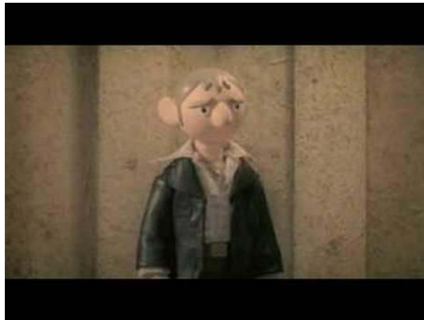
Fig. 11: Sam Tyler, personnage de Camberwick Green .

La ritournelle opère néanmoins quelques changements : la boîte dont sort la marionnette n'est plus « musical » mais « magical » ; si le Manchester de 1973 est bien appréhendé comme un monde clos et magique, l'innocence pastorale de Camberwick Green est remplacée par la violence de la ville incarnée par Gene Hunt, lui aussi miniaturisé et transformé en jouet. Selon Giorgio Agamben, la miniaturisation du jouet permet de rendre « présente et tangible la temporalité humaine en soi, le pur écart différentiel entre l'« autrefois » et le « plus maintenant » 17 . » La clôture et la miniaturisation permettent de « connaître le tout avant les parties et de surmonter, en le mesurant d'un seul coup d'œil, ce que l'objet peut avoir de redoutable 18 . » Le dispositif ainsi mis en place figure la tentative de Sam de maîtriser le temps et de se saisir de son histoire. La série joue avec les registres en incorporant des considérations adultes dans le monde de l'enfance : la naïveté du cadre (la boîte à musique, les marionnettes) s'oppose à la crudité de la scène montrant Gene Hunt en train de frapper un homme à terre avec le couvercle d'une poubelle – le procédé fait penser à un oxymore visuel, soulignant la crise identitaire de Life on Mars (est-ce une série policière ou fantastique ?) et de son personnage principal.