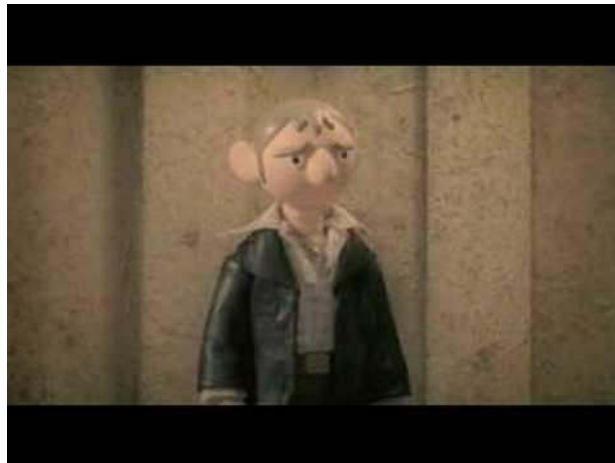
Fig. 11: Sam Tyler, personnage de Camberwick Green .

La ritournelle opère néanmoins quelques changements : la boîte dont sort la marionnette n'est plus « musical » mais « magical » ; si le Manchester de 1973 est bien appréhendé comme un monde clos et magique, l'innocence pastorale de Camberwick Green est remplacée par la violence de la ville incarnée par Gene Hunt, lui aussi miniaturisé et transformé en jouet. Selon Giorgio Agamben, la miniaturisation du jouet permet de rendre « présente et tangible la temporalité humaine en soi, le pur écart différentiel entre l'« autrefois » et le « plus maintenant » 17 . » La clôture et la miniaturisation permettent de « connaître le tout avant les parties et de surmonter, en le mesurant d'un seul coup d'œil, ce que l'objet peut avoir de redoutable 18 . » Le dispositif ainsi mis en place figure la tentative de Sam de maîtriser le temps et de se saisir de son histoire. La série joue avec les registres en incorporant des considérations adultes dans le monde de l'enfance : la naïveté du cadre (la boîte à musique, les marionnettes) s'oppose à la crudité de la scène montrant Gene Hunt en train de frapper un homme à terre avec le couvercle d'une poubelle – le procédé fait penser à un oxymore visuel, soulignant la crise identitaire de Life on Mars (est-ce une série policière ou fantastique ?) et de son personnage principal.