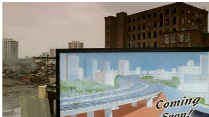
Fig. 1: Manchester en 1973

rassurant et, croit-il, maîtrisé : son commissariat. L'officier qui le découvre désorienté ne lui demande-t-il pas : « Didn't you read the sign? », la polysémie de « sign » (panneau/signe) annonçant la valeur programmatique de la séquence. Il s'agit pour le héros, et le spectateur avec lui, d'apprendre à interpréter les signes afin de (re)construire le sens de la vie/ville. Les grands ensembles de Satchmore Road en arrière-plan sont ceux-là mêmes où Sam menait son enquête en 2006 ; le terrain vague où il gît n'est autre que le chantier de destruction des anciennes manufactures textiles qui firent les beaux jours de la ville pendant la révolution industrielle : à présent à l'abandon, elles vont céder leur place à l'autoroute suspendue, dont l'érection prochaine est annoncée par un panneau publicitaire, «Coming Soon : Manchester Highway in the Sky » (voir figure 1).