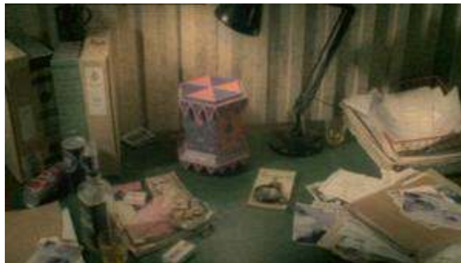
Fig. 10 : La version adulte et policière de Camberwick Green dans Life on Mars .

Le pré-générique de cet épisode de Life on Mars reprend les codes visuels et narratifs établis par l'émission pour enfants : la voix off du narrateur emprunte les mêmes intonations et reproduit, à quelques détails près, la même formule rituelle. Pour autant, la marionnette est celle de Sam, reconnaissable à sa veste en cuir et à son pantalon à pattes d'éléphant (voir figure 11) :