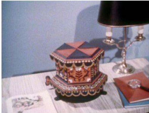
Fig. 9 : La version originale du générique d'ouverture de Camberwick Green .