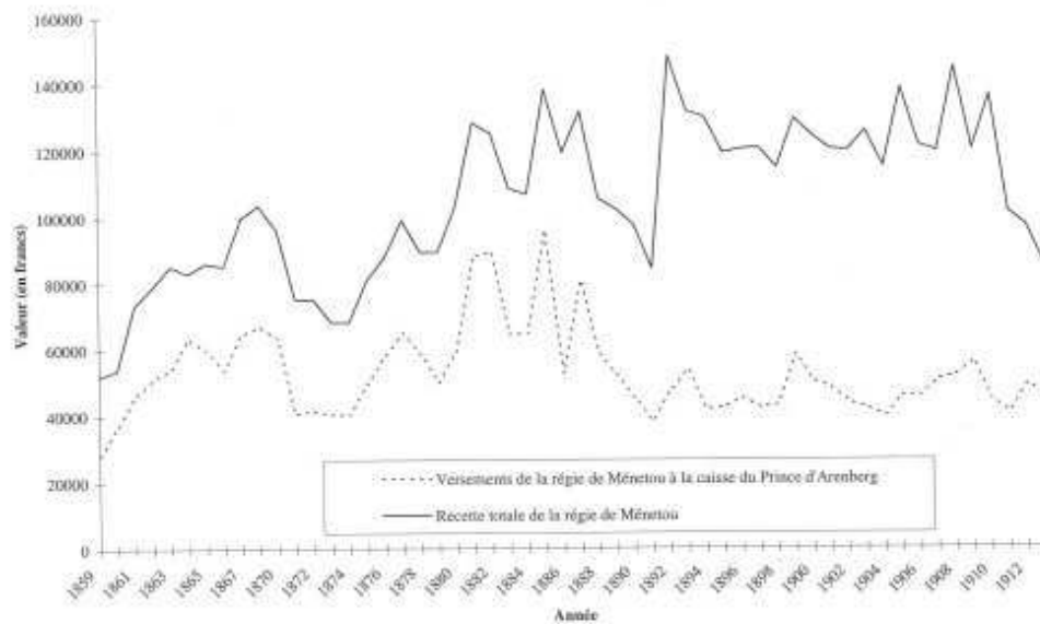
Figure 1 : Revenus tirés de la régie de Ménéto-Salou (1859-1913)