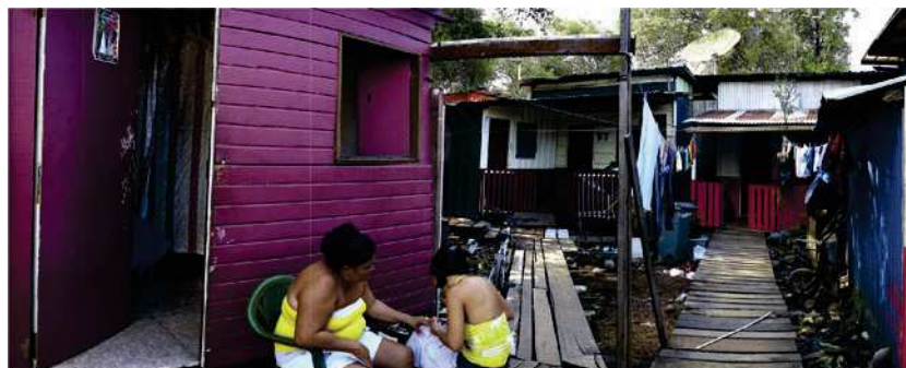
Figure 4 - Paysage urbain, quartier Mathina, Cayenne.

Tirage numérique sur Dibon. Format 30,4 x 75 cm