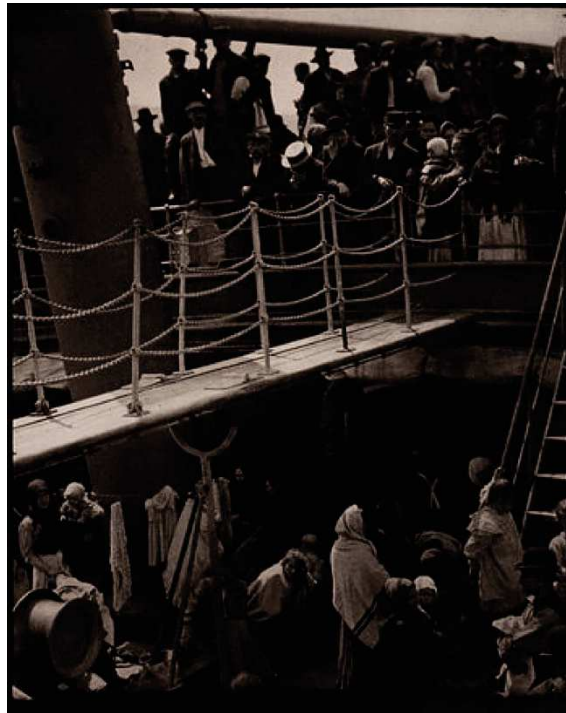
Figure 2 - Alfred Steiglitz. The Steerage 1911, prise de vue de 1907

Epreuve photomécanique (photogravure) sur papier japon. Format 33,2 x 26,3 cm.