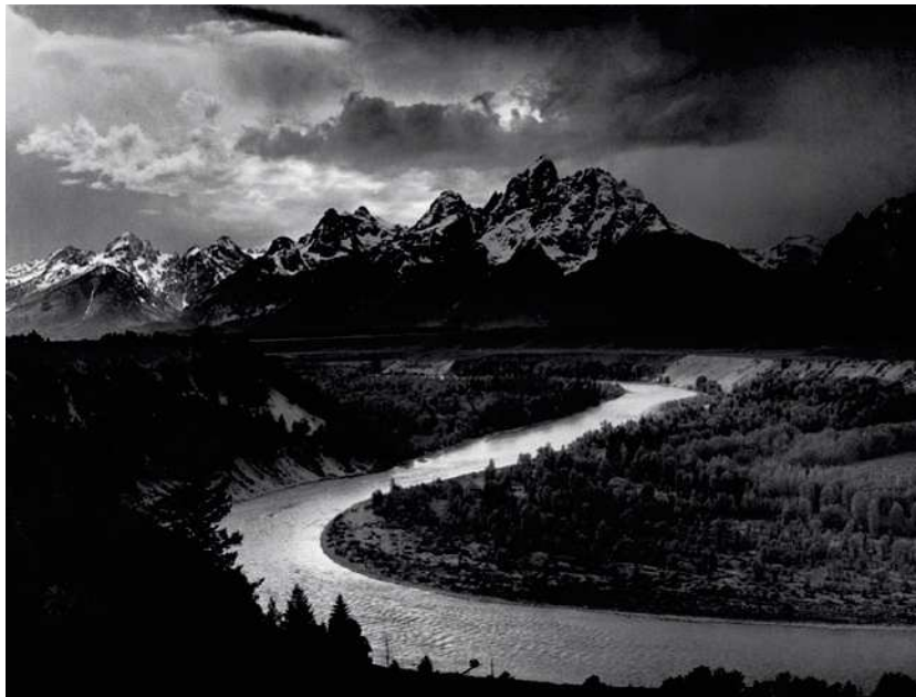
Figure 3 - Ansel Adams, 1942 (tirage gélatino-argentique) - The Tetons and Snake River, Grand Teton National Park, Wyoming, USA.

Source : © National Archives and Records Administration, Records of the National Park Service. (79-AAG-1) 10