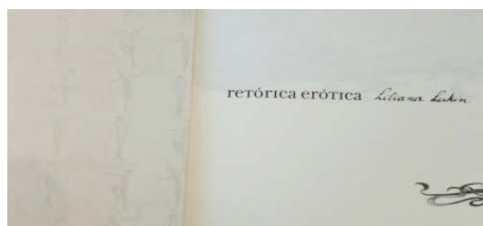
Ill. 2. Liliana Lukin, retórica erótica , Buenos Aires : Asunto impreso ediciones, 2006 (2a ed.). Sin página

“Dos veces, marcada por la voluntad”: ese verso “marcado”-inscripto/caligrafiado-, que se desborda a la izquierda, en la página de al lado, insinuándose apenas en el marco de la fotografía, en la parte inferior de la fotografía, como un amago de enlace entre territorios (in)conexos, los de la palabra y los de la imagen, enlazados por la Letra, los rizos de la cabellera, las iniciales: L.L., eLLa, desde el inicio, desde la primera página.