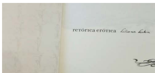
Ill. 2. Liliana Lukin, retórica erótica , Buenos Aires : Asunto impreso ediciones, 2006 (2a ed.). Sin página

“Dos veces, marcada por la voluntad”: ese verso “marcado”-inscripto/caligrafiado-, que se desborda a la izquierda, en la página de al lado, insinuándose apenas en el marco de la fotografía, en la parte inferior de la fotografía, como un amago de enlace entre territorios (in)conexos, los de la palabra y los de la imagen, enlazados por la Letra, los rizos de la cabellera, las iniciales: L.L., eLLa, desde el inicio, desde la primera página.