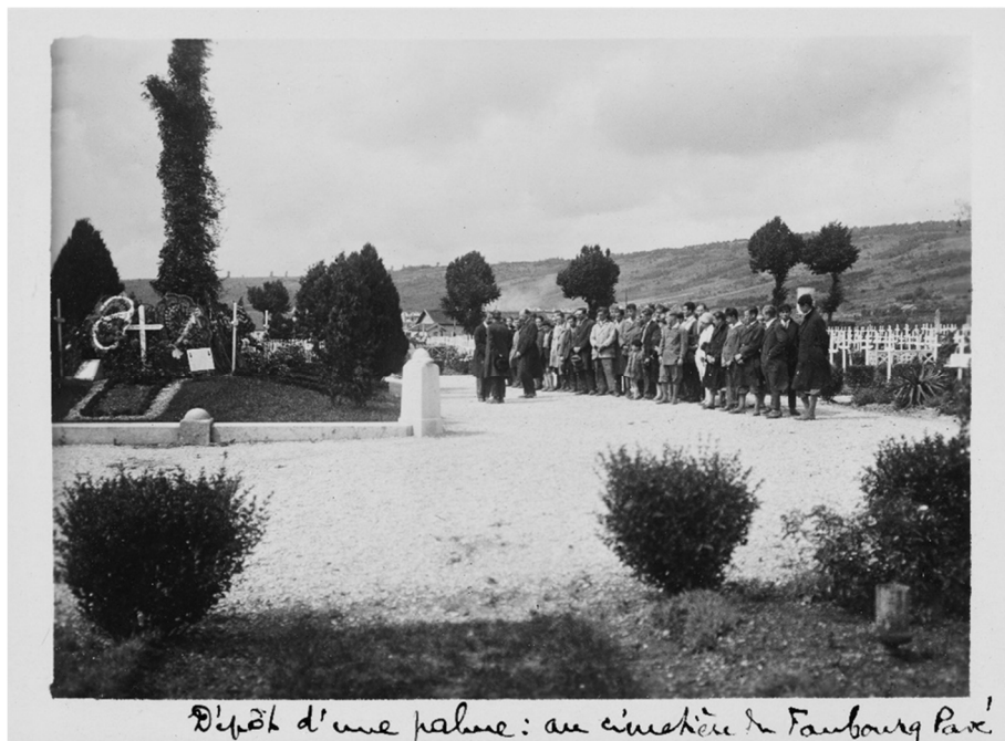
Fig. 2 : Les élèves allemands et français du foyer de Charleville lors d'un dépôt de palme au cimetière français du Faubourg Pavé, à Verdun, en été 1930.

Verdun, l'élève rapporte enfin avoir déposé, avec ses camarades, au monument aux morts de Brandebourg, une gerbe aux couleurs allemandes et françaises, en un geste qui aurait été très apprécié par la population locale 74 .