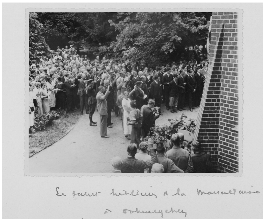
Fig. 3 : Photographie légendée « Le salut hitlérien à la Marseillaise à Hohenlychen », juillet 1933.

Sur cette photographie prise en juillet 1933 lors d'une cérémonie organisée pour les élèves du foyer, on voit des adultes mais aussi de jeunes garçons effectuer le salut hitlérien, tandis que d'autres jeunes gens, probablement des élèves français, se tiennent au premier rang, les mains dans le dos ou les bras raides le long du corps. À l'arrière-plan figure un drapeau portant la croix gammée. Ainsi, sans être arboré par des élèves ou des professeurs du foyer franco-allemand, le drapeau nazi est bien présent, ce qui contourne l'esprit sinon la lettre de la convention d'organisation.